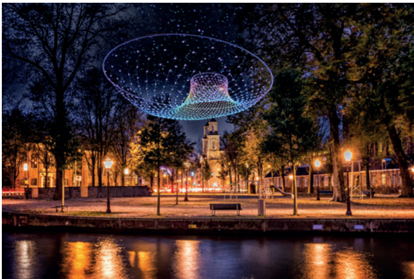
Parabolic Lightcloud, amigo & amigo, artist impression

DOOR DE TOEPASSING VAN LED IS HET ENERGIEVERBRUIK AANZIENLIJK AFGENOMEN